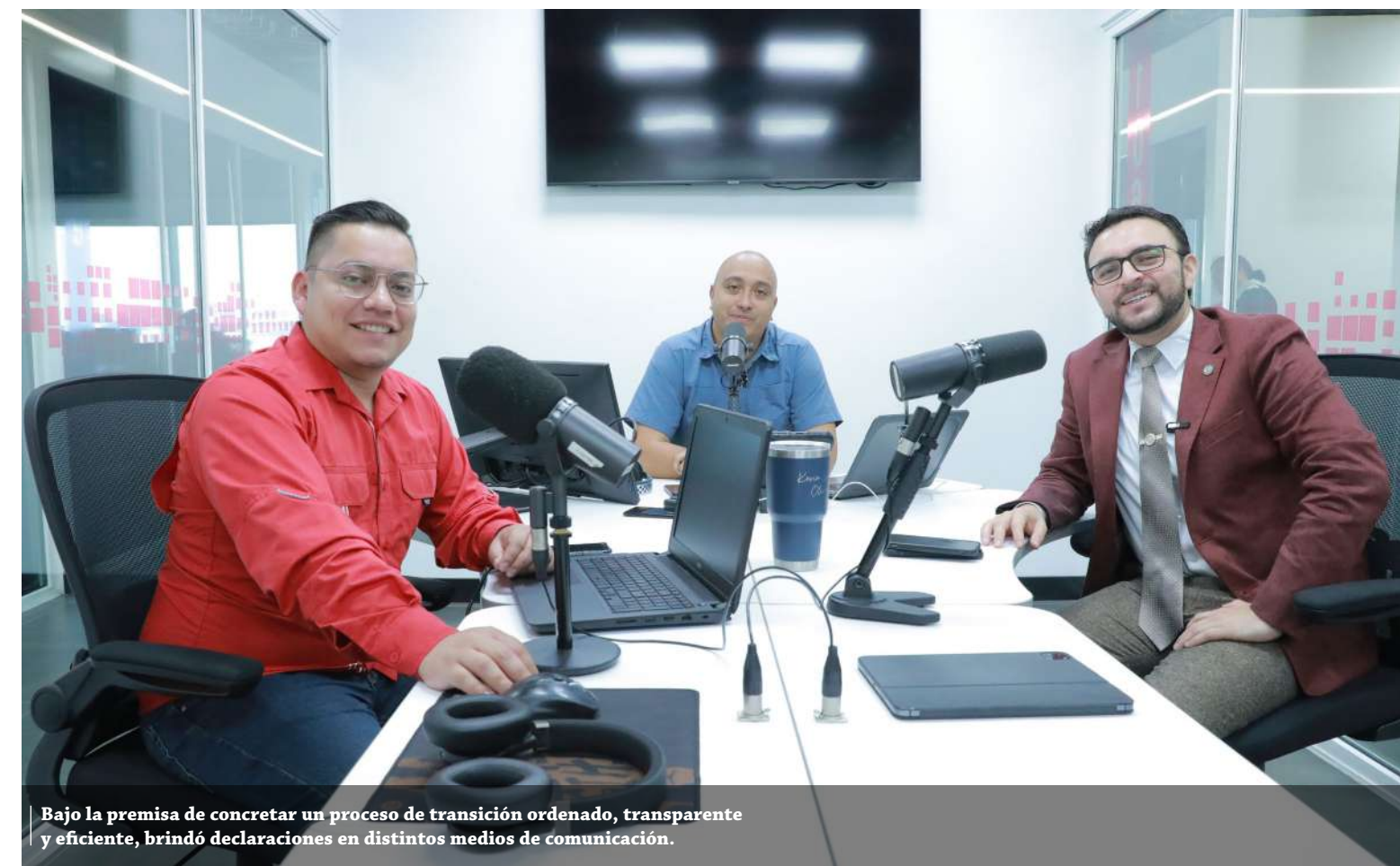
Bajo la premisa de concretar un proceso de transición ordenado, transparente y eficiente, brindó declaraciones en distintos medios de comunicación.