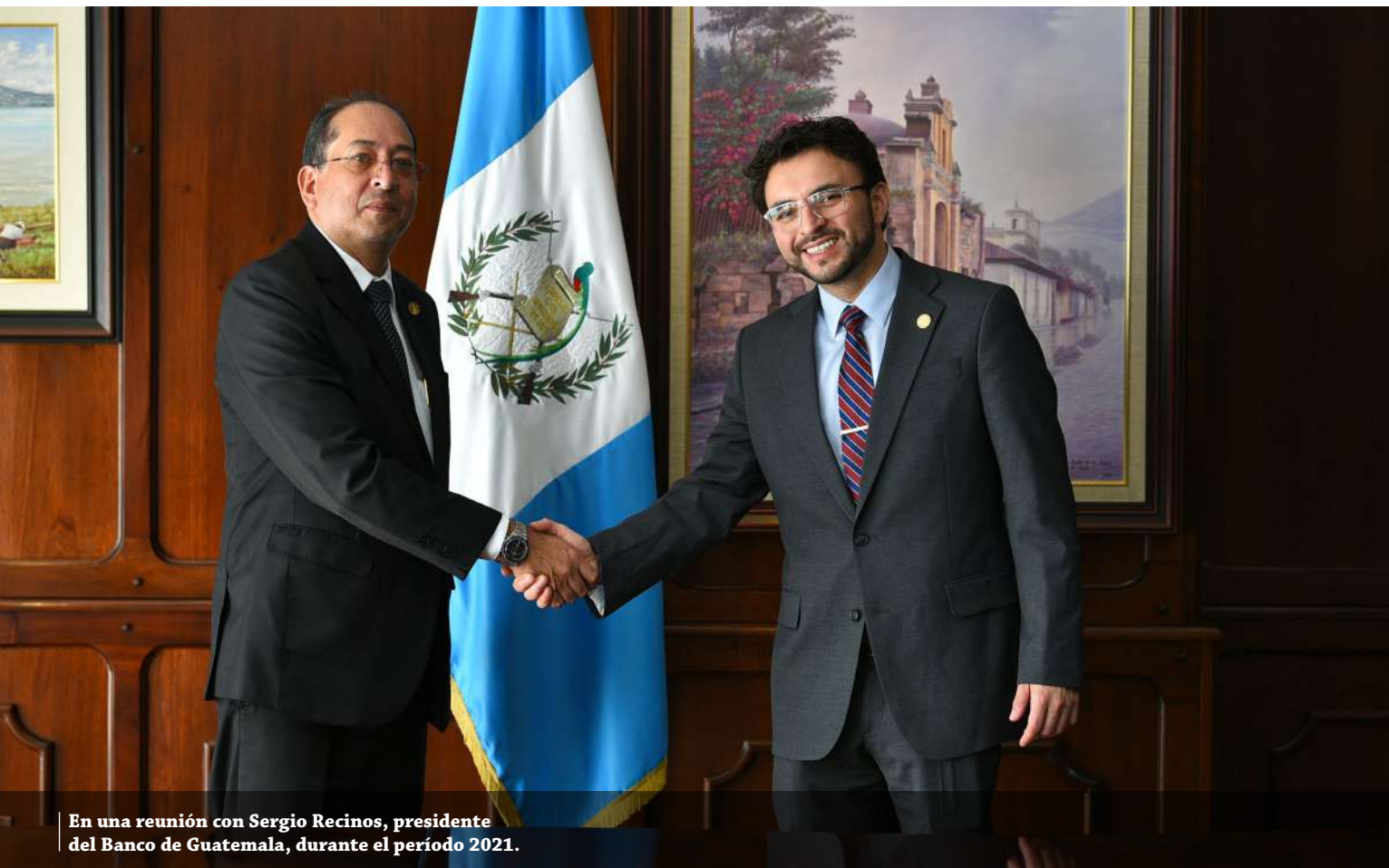
En una reunión con Sergio Recinos, presidente del Banco de Guatemala, durante el periodo 2021.