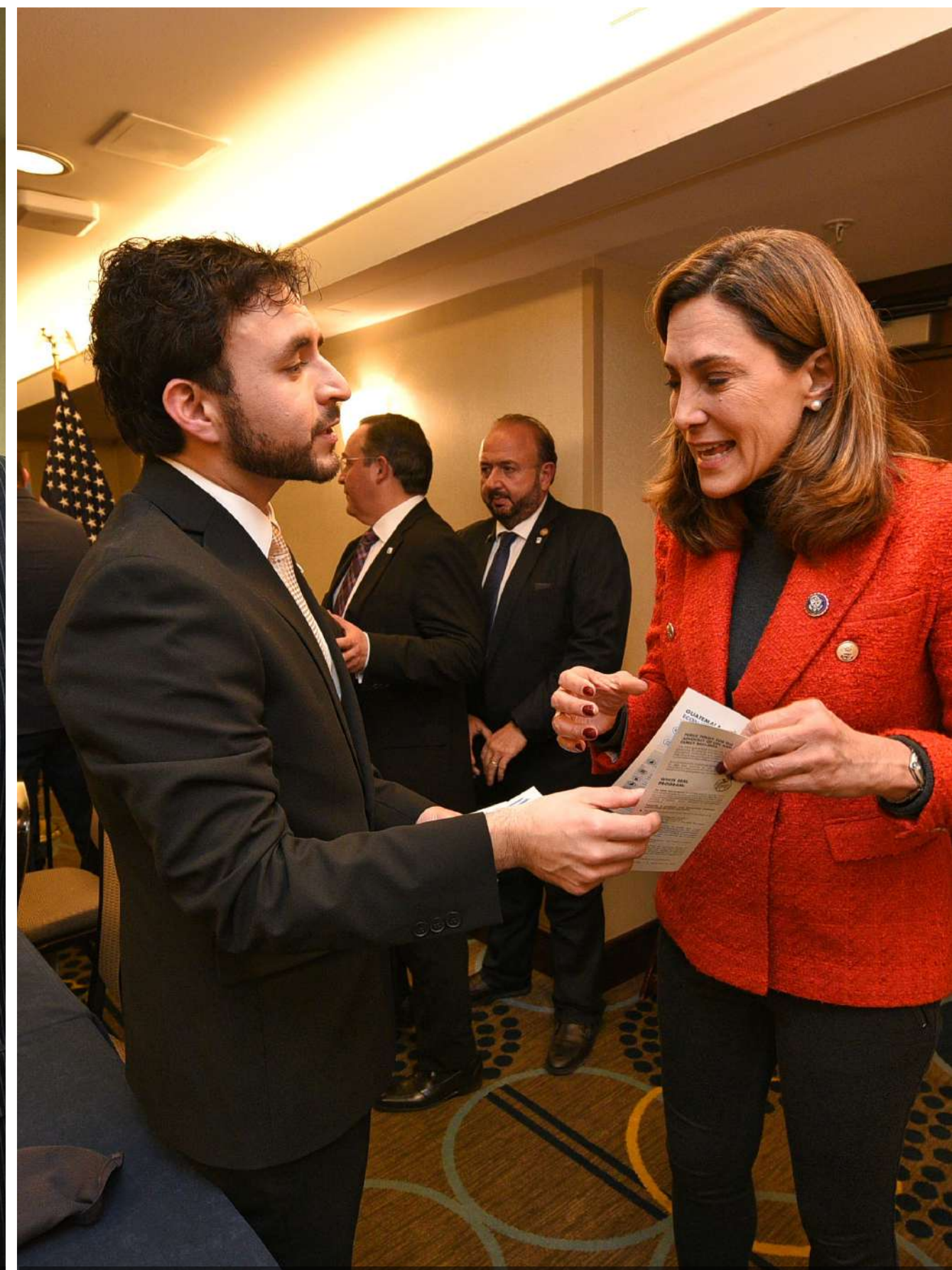
En compañía de María Elvira Salazar, congresista republicana por el Estado de Florida, Estados Unidos.