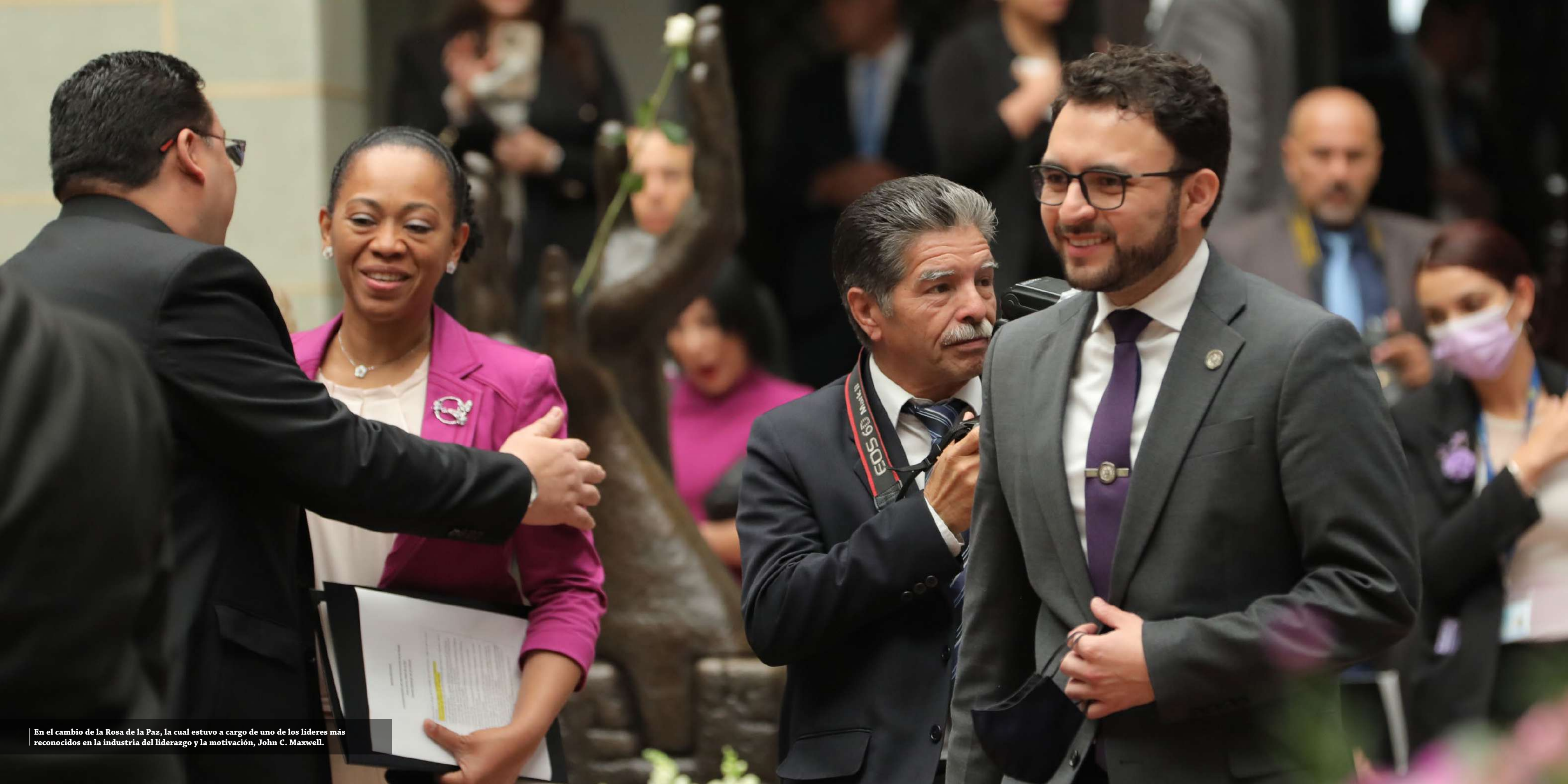
En el cambio de la Rosa de la Paz, la cual estuvo a cargo de uno de los líderes más reconocidos en la industria del liderazgo y la motivación, John C. Maxwell.