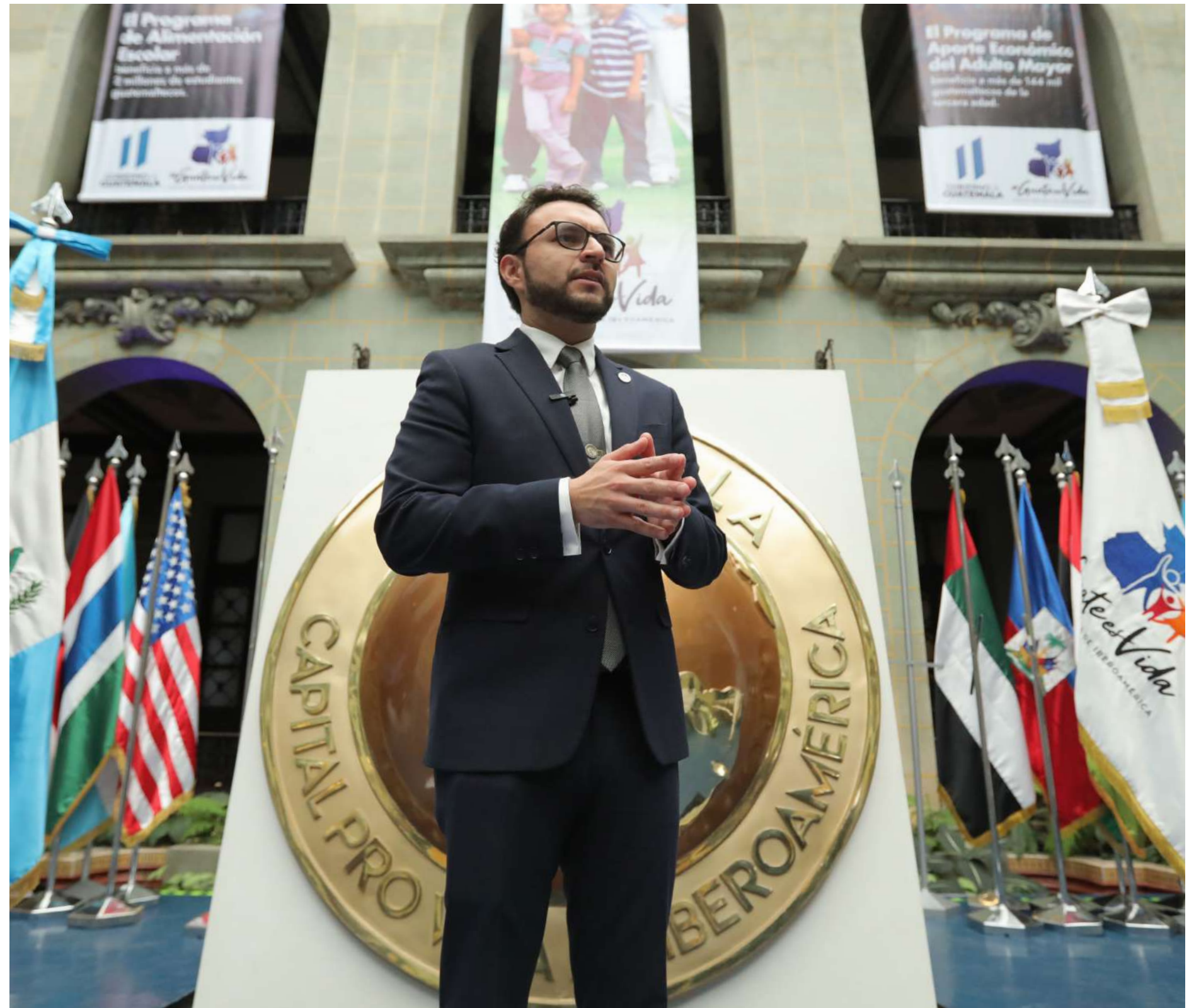
Declaraciones a la prensa en el aniversario de la designación de Guatemala como Capital Pro Vida de Iberoamérica.