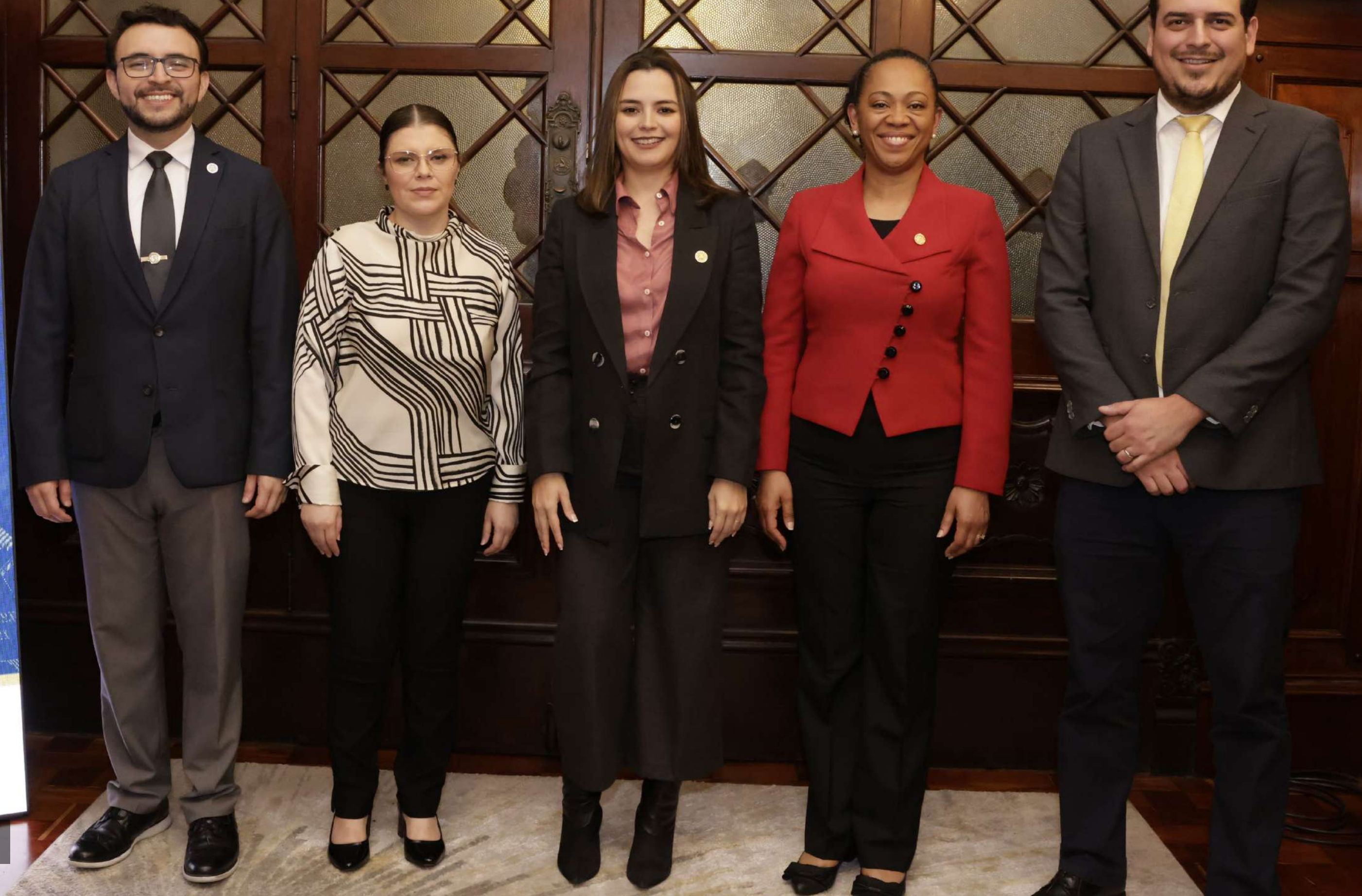
La Comisión de Transición nombrada por el Presidente Alejandro Giammattei.