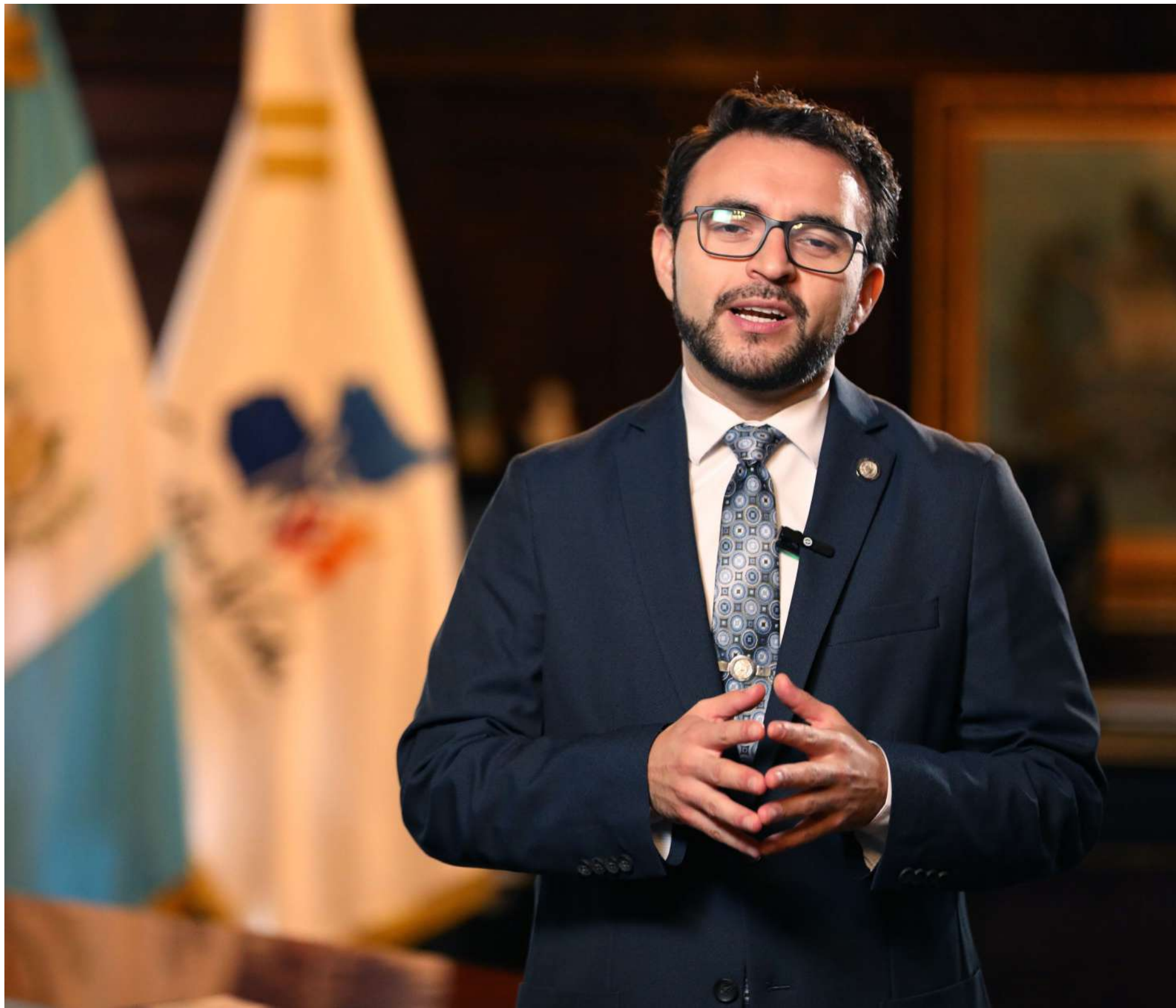
En su despacho abordando el tema del proceso de transición, un hecho histórico y único en Guatemala.