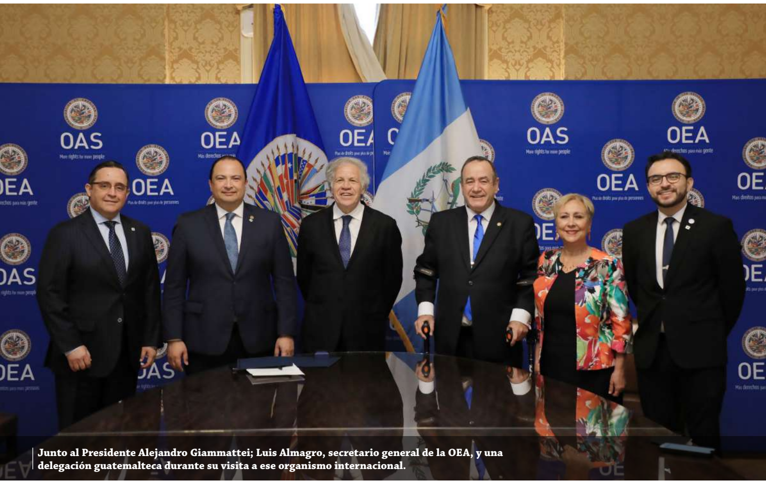
Junto al Presidente Alejandro Giammattei; Luis Almagro, secretario general de la OEA, y una delegación guatemalteca durante su visita a ese organismo internacional.