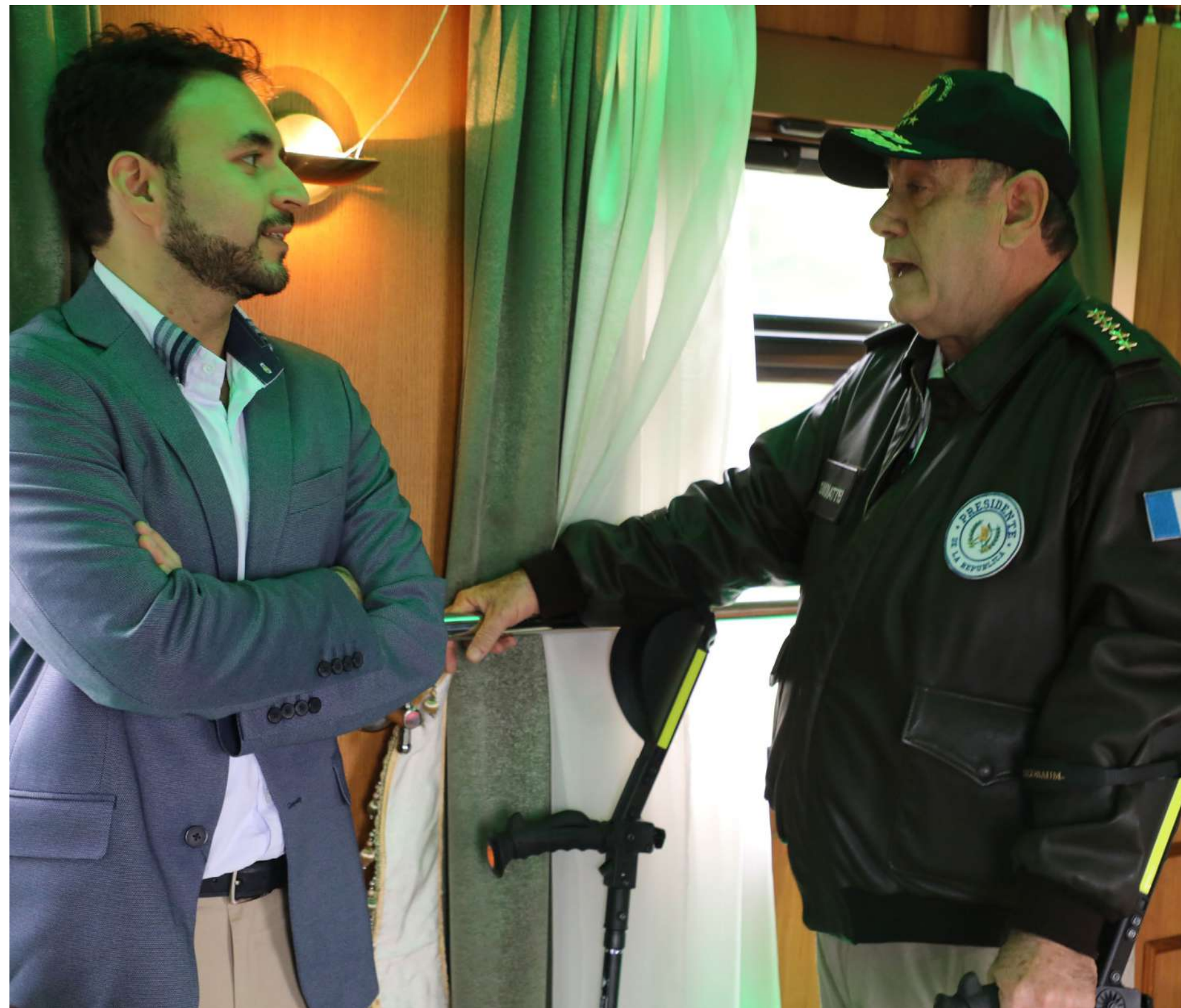
Junto al gobernante guatemalteco, en un recorrido en un tren especial, durante la visita que hicieron a Ucrania para llevar un mensaje de paz.