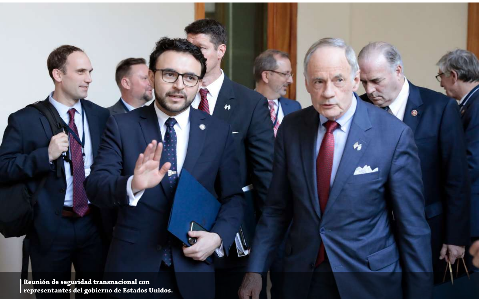
Reunión de seguridad transnacional con representantes del gobierno de Estados Unidos.