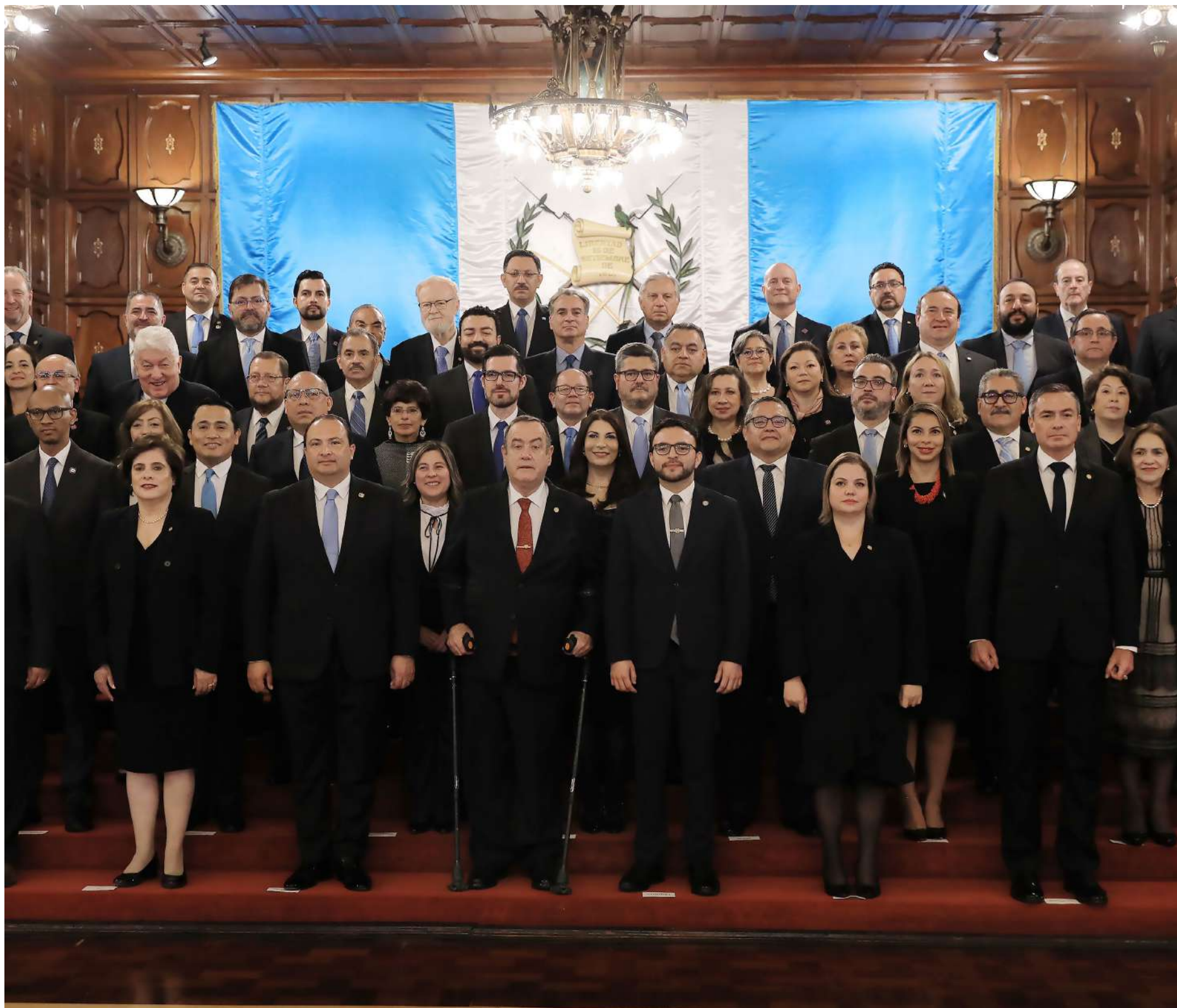
Durante la reunión con los jefes de misiones diplomáticas guatemaltecas en el exterior.