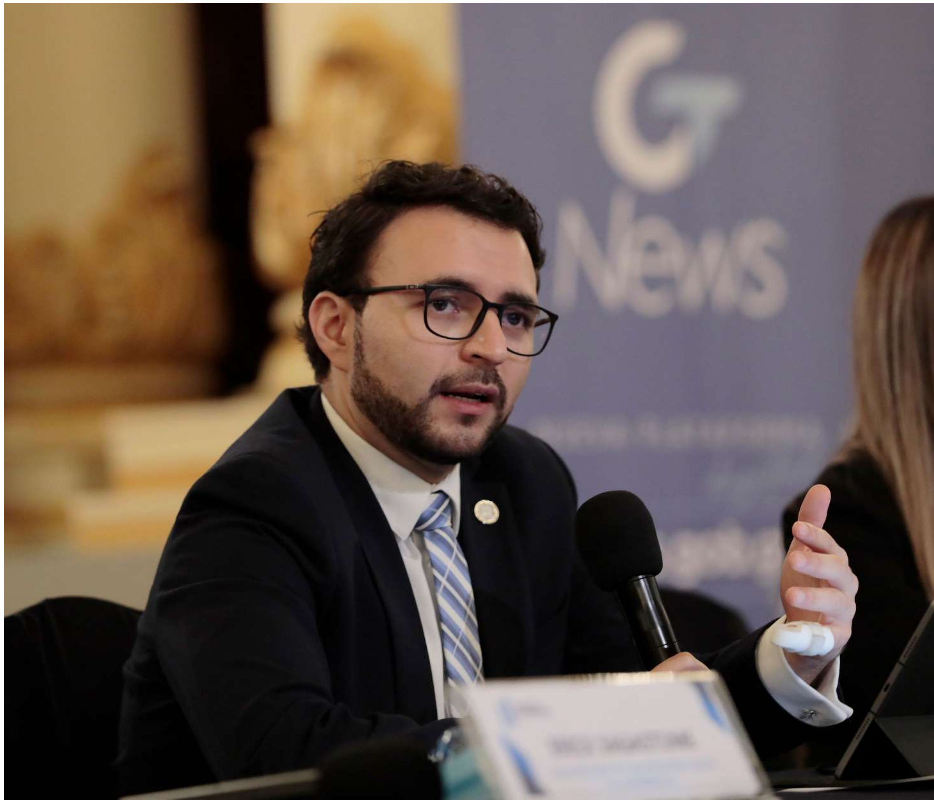
En la presentación del portal de información en inglés GT News.