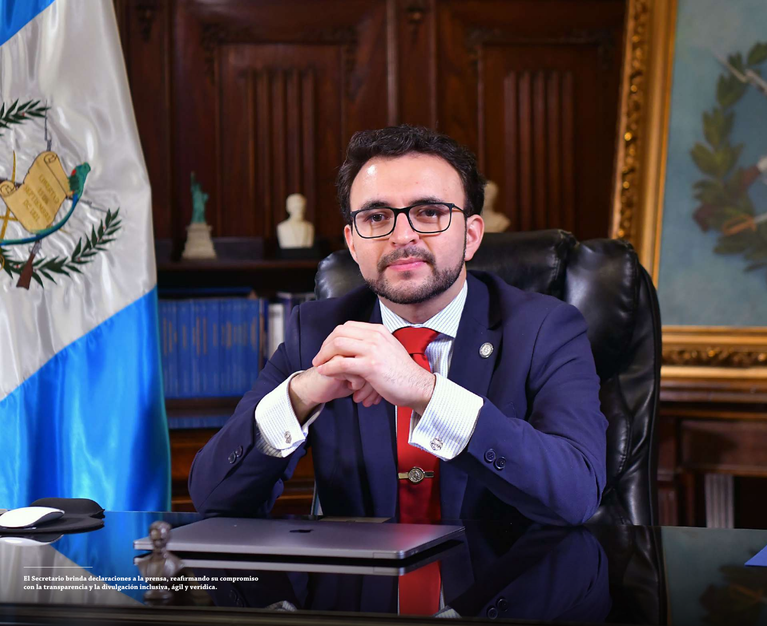
El Secretario brinda declaraciones a la prensa, reafirmando su compromiso con la transparencia y la divulgación inclusiva, ágil y verídica.