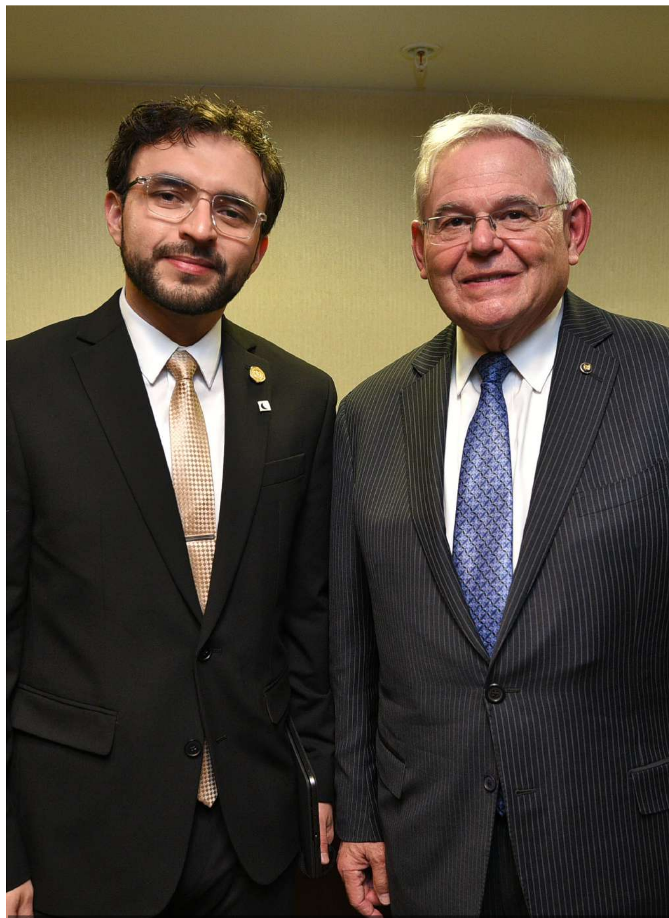
Junto al senador demócrata por el Estado de New Jersey, Estados Unidos, Robert Menéndez.