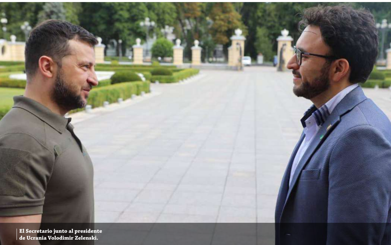
El Secretario junto al presidente de Ucrania Volodimir Zelenski.