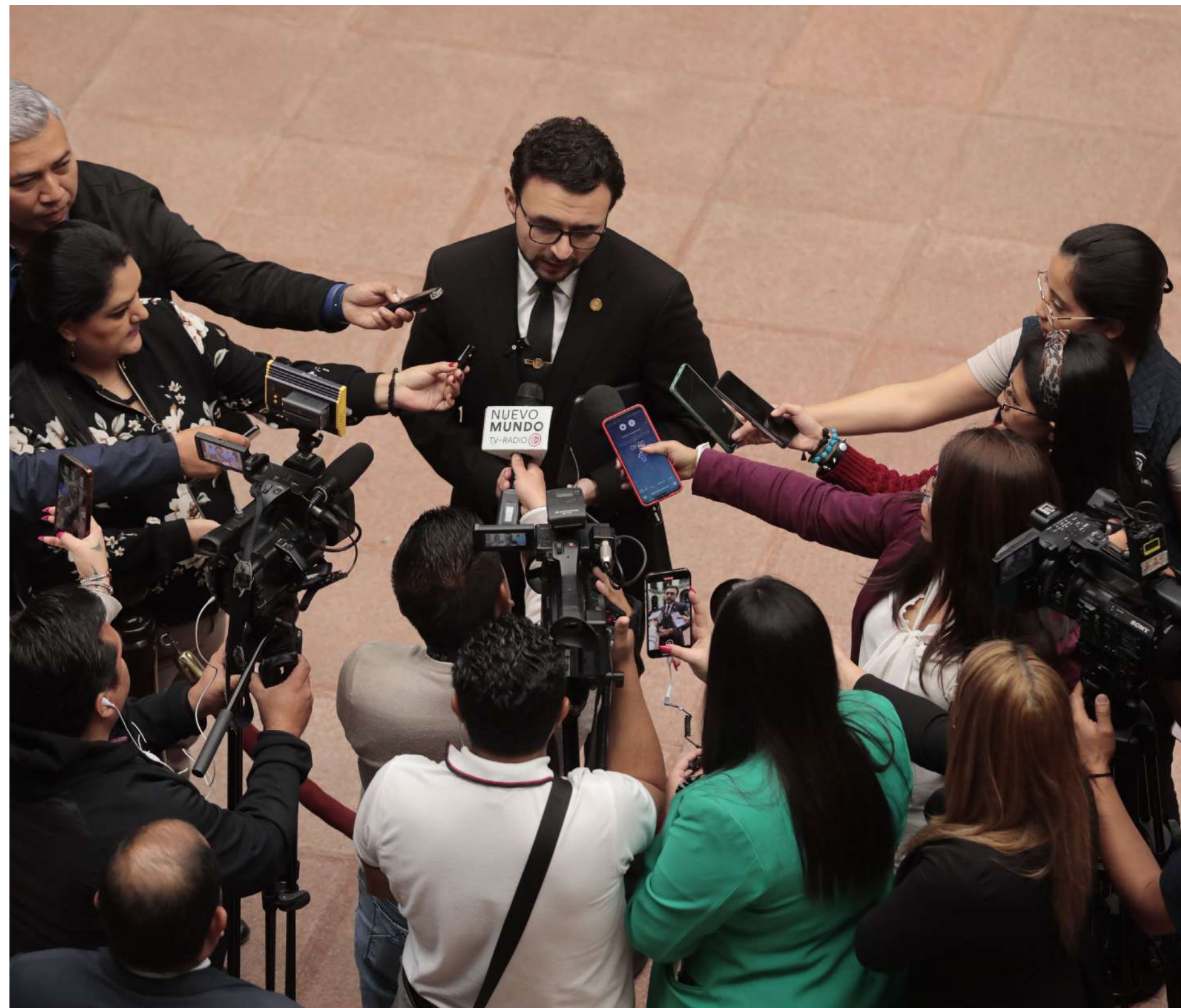
En cumplimiento de su labor de brindar información a los distintos medios de comunicación nacional e internacional.