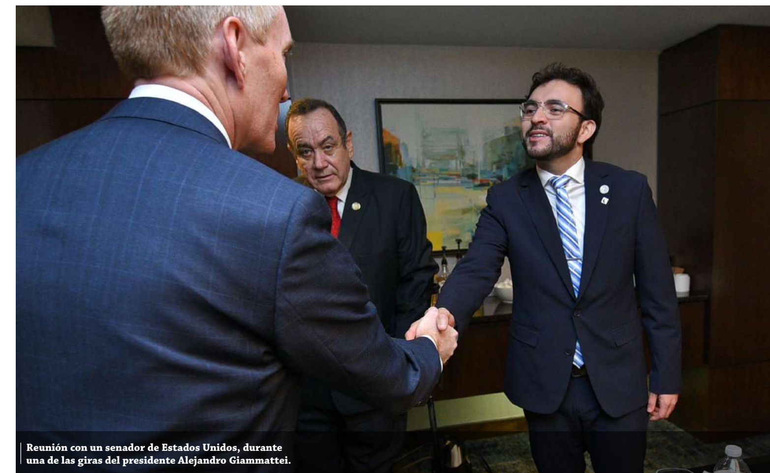
Reunión con un senador de Estados Unidos, durante una de las giras del presidente Alejandro Giammattei.