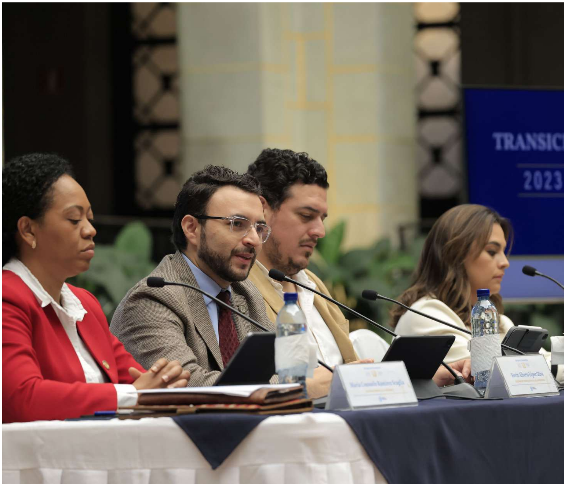
La Comisión de Transición dio detalles de los avances de las reuniones sectoriales con los equipos del gobierno electo.