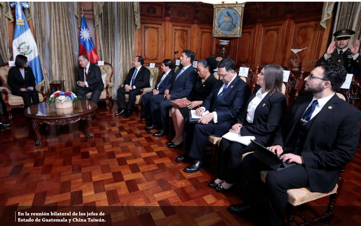
En la reunión bilateral de los jefes de Estado de Guatemala y China Taiwán.