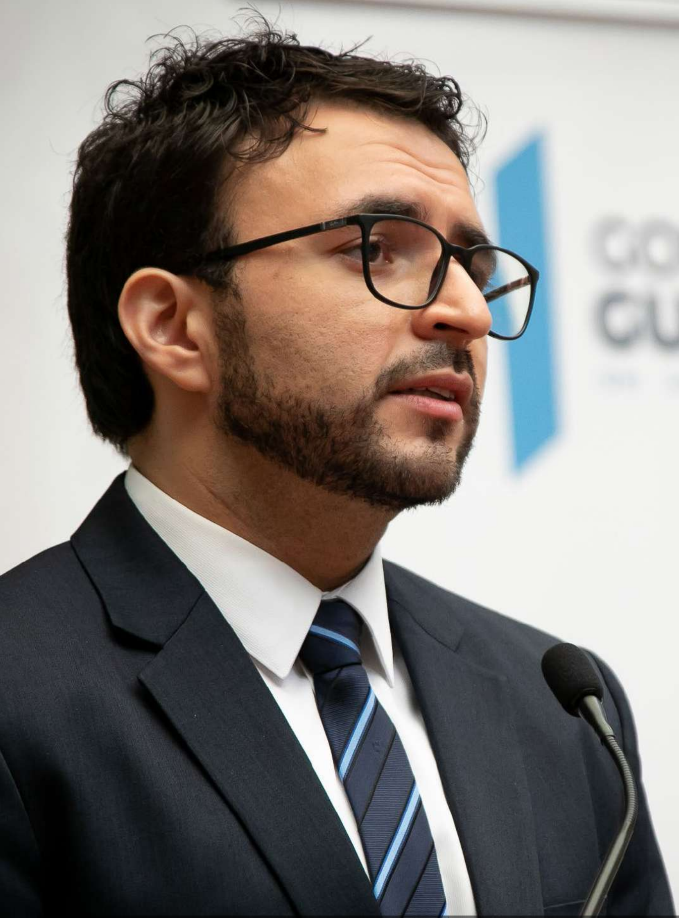
El Secretario de Comunicación Social de la Presidencia de la República, da declaraciones a los medios de comunicación, cumpliendo así con su función de divulgar e informar.