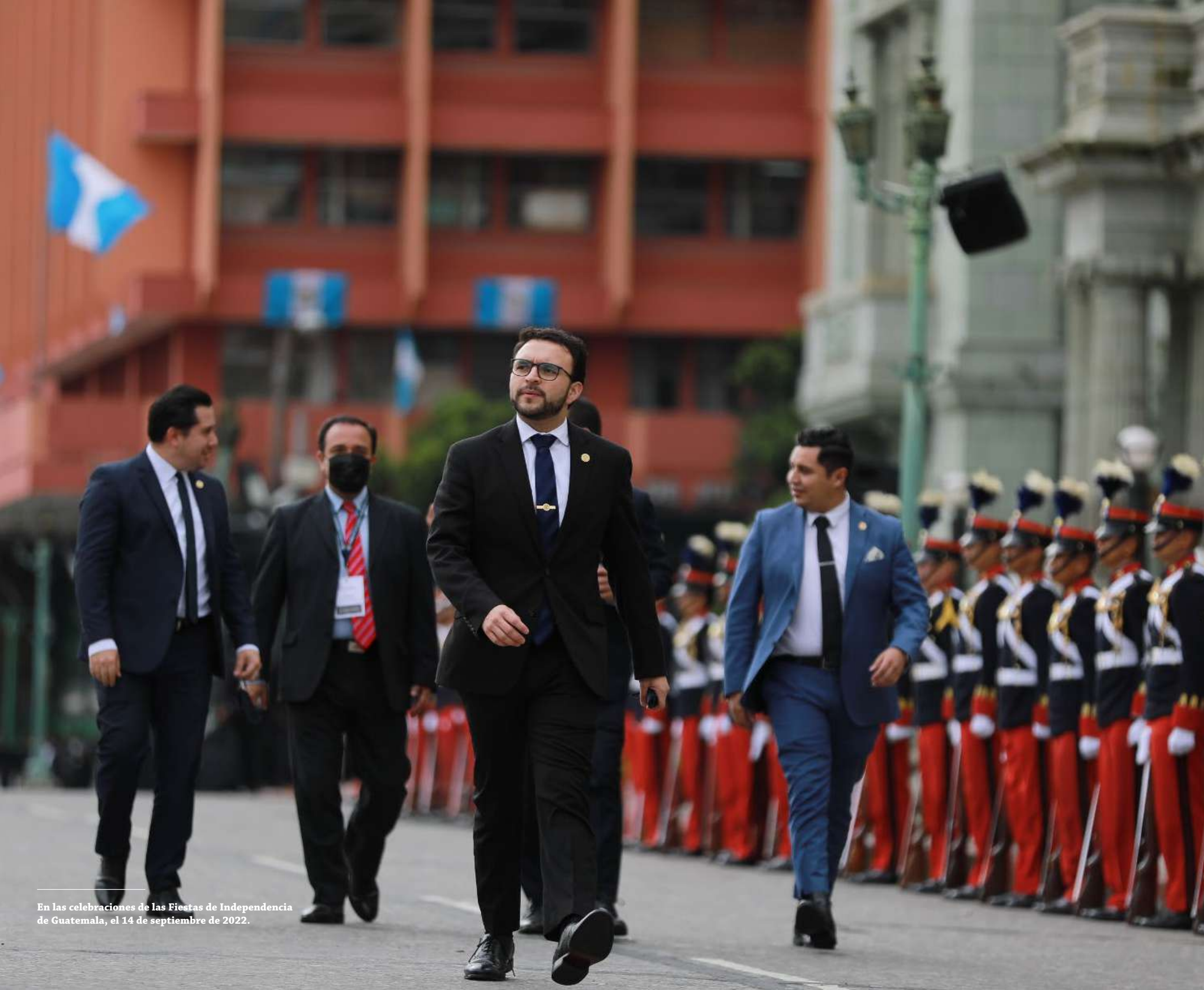
En las celebraciones de las Fiestas de Independencia de Guatemala, el 14 de septiembre de 2022.