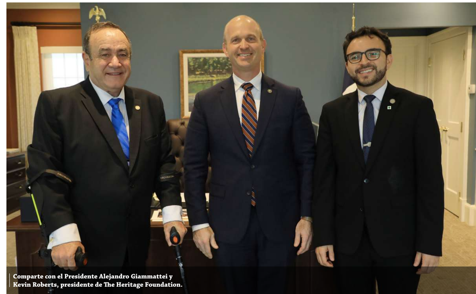
Comparte con el Presidente Alejandro Giammattei y Kevin Roberts, presidente de The Heritage Foundation.