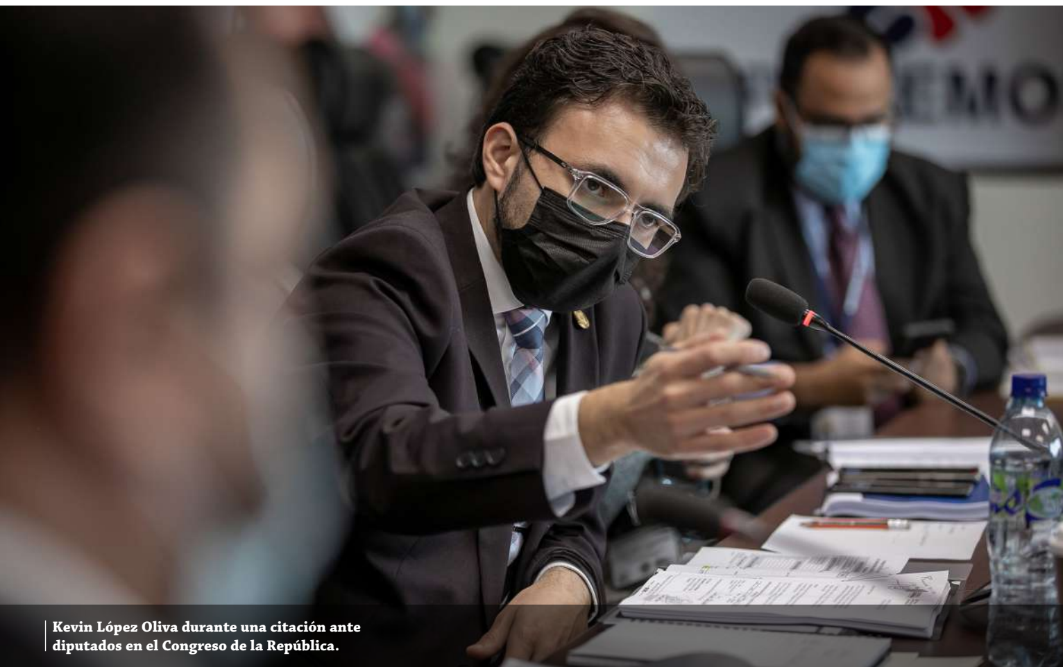
Kevin López Oliva durante una citación ante diputados en el Congreso de la República.